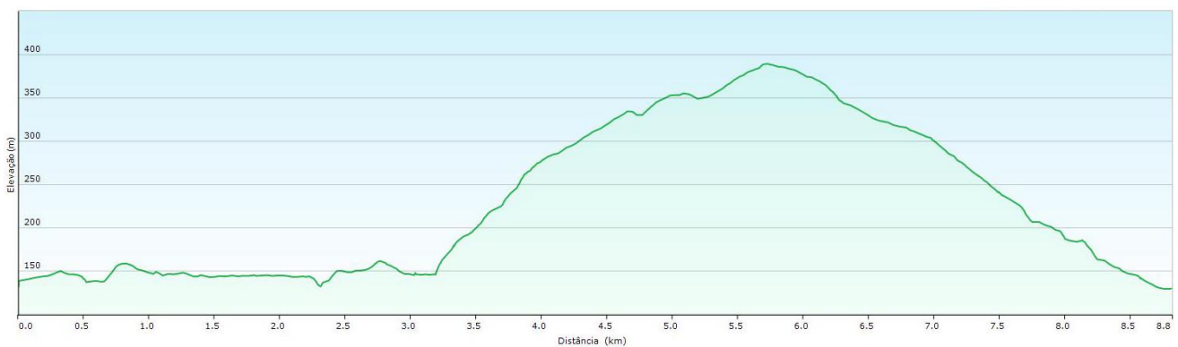
Percurso Pedestre – POMBEIRA – PERFIL DE ELEVAÇÃO