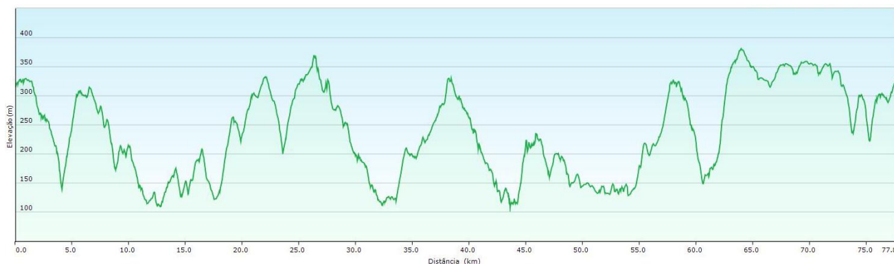
Percurso TT Nº 1 – PERFIL DE ELEVAÇÃO