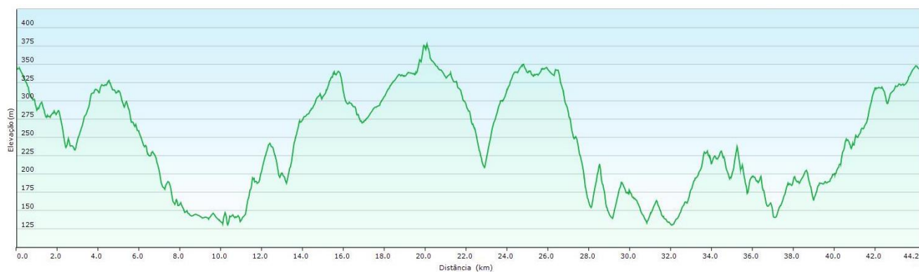
Percurso TT Nº 3 – PERFIL DE ELEVACÃO